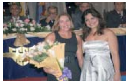
Homenagem à esposa do Presidente da Mesa Diretora