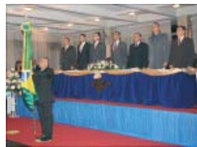
Homenagem ao Dia da Bandeira