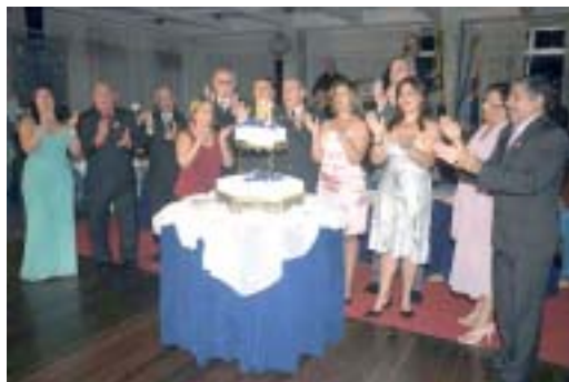
Parabéns aos 80 anos do CSSA