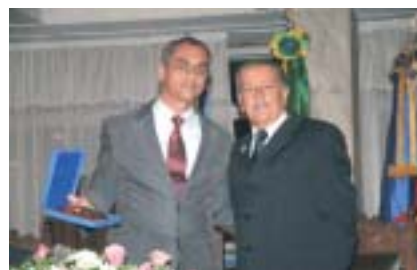
Entrega de placa ao Presidente da Mesa Diretora